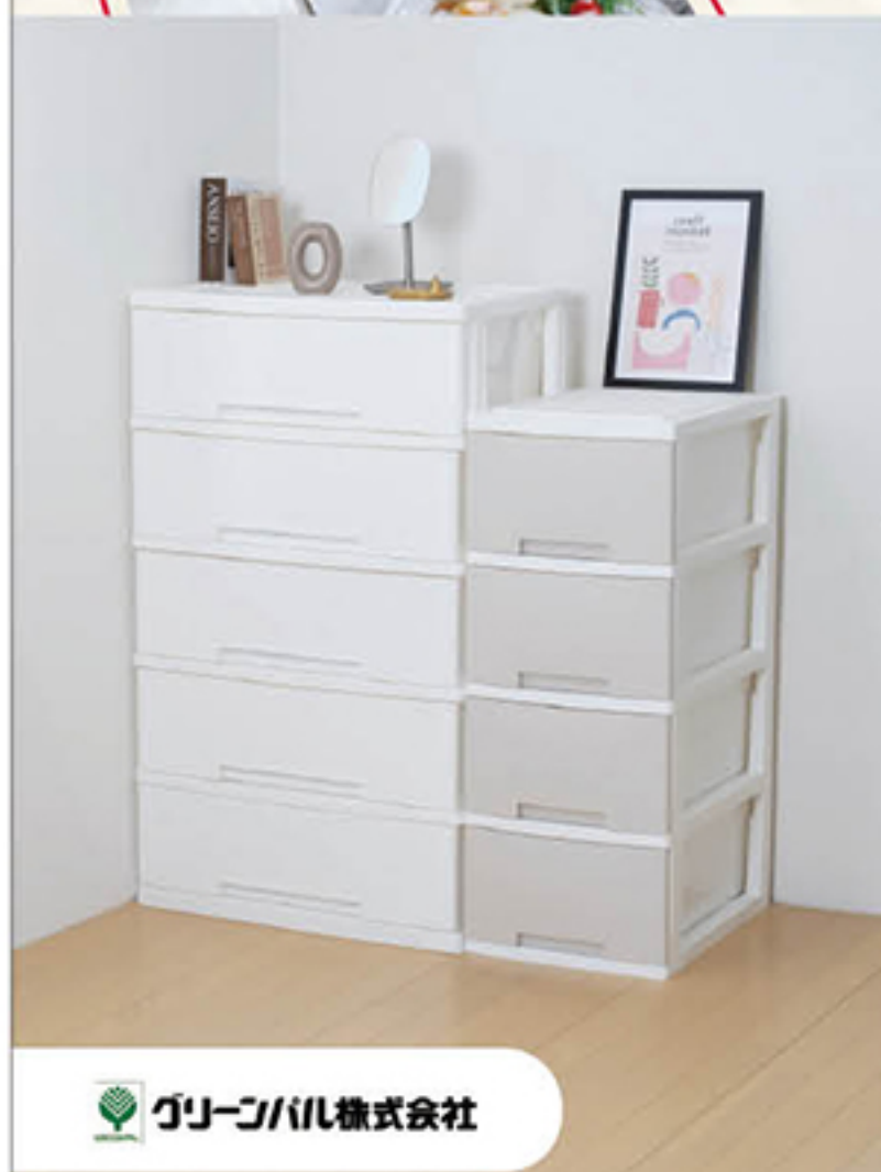
グリーンパル株式会社