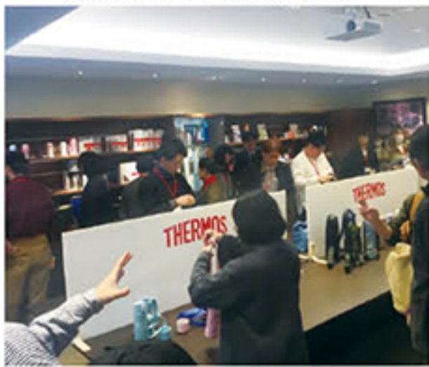
本社ショールーム