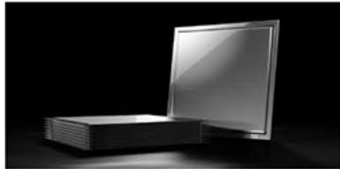
ステンレス密封真空断熱パネル

真空断熱資材など タイガー魔法瓶 万博出展 タイガー魔法瓶は大阪関西万博で冷蔵冷凍輸送ボックスや輸送コンテナに搭載のパネル(ステンレス密封真空断熱パネル)、建築・建材用の断熱資材などを展示紹介する。期間は万博開催中の10月7日~13日。 大阪府の「カーボンニュートラル技術開発・実証事業」の支援を受けて断熱技術の開発・実証事業に取り組んでいるもので、チャレンジャー企業を後押しを受ける形で、展示することになった。