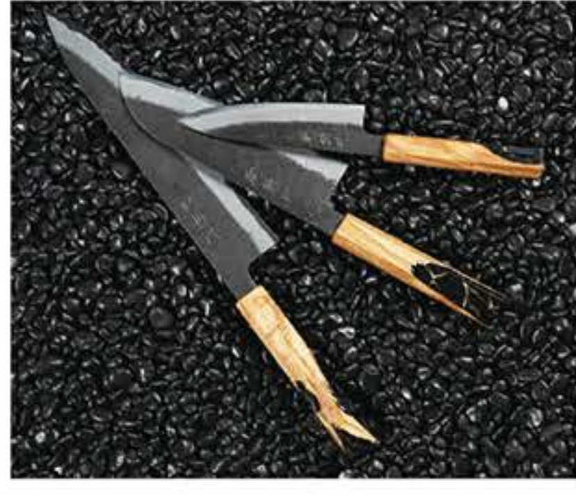
庵斬巴がジャパン・ツバ

高級和包丁のコンセプトは「自然の美しさと伝統技術の融合」。 透明レジンの柄を天然木から湧き出る樹液に見立てており、黒仕立ての刃は溶岩が冷えて固まった台地をイメージさせるデザイン。焼き入れ時の酸化被膜をそのまま使用した黒打ち刃。刃は特殊鋼材材割込白紙2号を使用している。 「庵斬巴」黒仕立て、牛刀240(白紙2号刃)、9万5920円(税込)、全長395mm、刃240mm、213g。