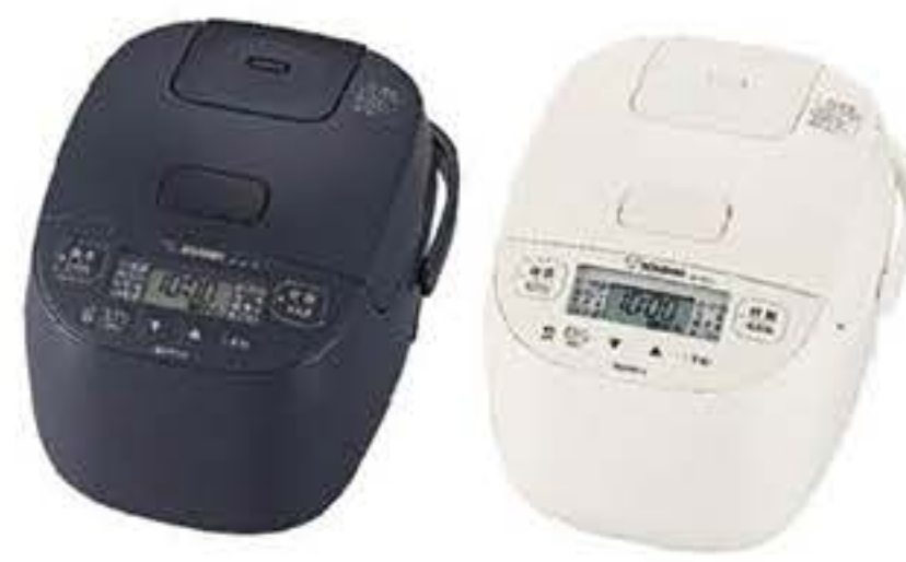
マイコン炊飯ジャー「極め炊き」NL-BF05 左より、ソフトブラック(BZ)、ソフトホワイト(WZ)

象印マホービン 小容量タイプのマイコン炊飯ジャー「極め炊き」(NL-BF) 熱が側面まで伝わりやすく、広く浅めの形状「2.5mmの黒厚釜」。ふきこぼれを抑える「大煎煮気口」。「パン(発酵・焼き)メニュー」。高火力で炊くからおいしい「豪華沸とう」&ハイパワー495W(最大電力)炊飯時の中パッパ工程で一気に火力を引き上げ、沸とう中も高火力を維持し、激しい対流を起こす。ふたヒーター付き。ふっくらおいしい「全面加熱」。上ふた・側面・釜底のヒーターが釜全体を包み込み、