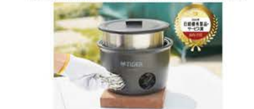
タイガー魔法瓶「魔法の成長性、独自性、産業・社会へのインパクトを総合的に評価したもので、今回は全受賞35点のうち、最優秀賞15点が選ばれた。

タイガー魔法瓶「魔法の成長性、独自性、産業・社会へのインパクトを総合的に評価したもので、今回は全受賞35点のうち、最優秀賞15点が選ばれた。関東大震災から100年を契機にタイガー魔法瓶は防災グッズを新提案。100周年記念モデル「魔法の成長性」として23年10月に発売した。1月17日、神戸市内で行われた「ひょうご安全の日」のついでに炊飯体験、おむすびの試食ができる「防災炊飯体験ブース」を出展した。